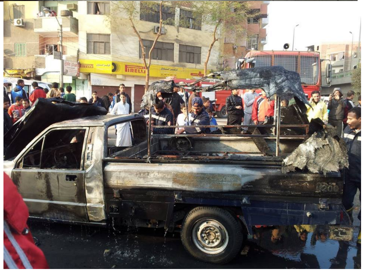
سويف اون لايين